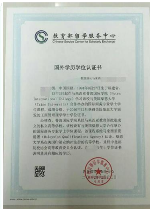
教育部留学服务中心出具的认证报告照片示例