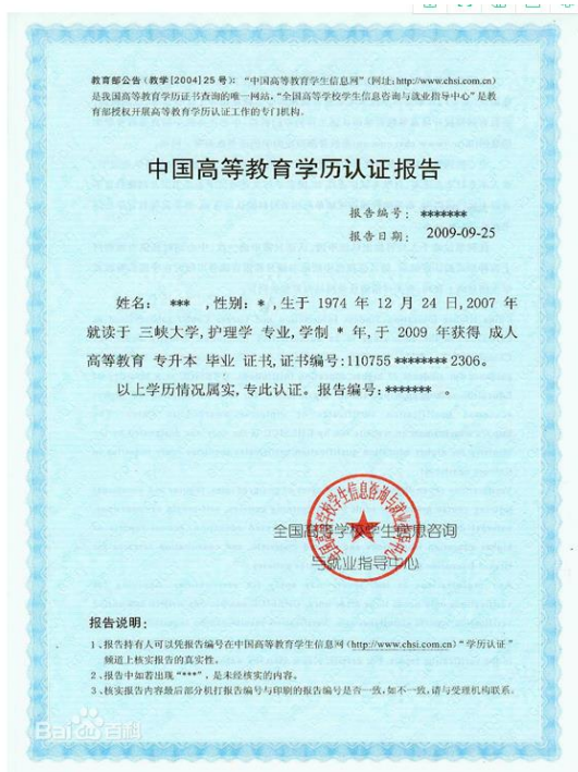
教育部学历认证报告照片示例