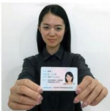
手持身份证照片示例